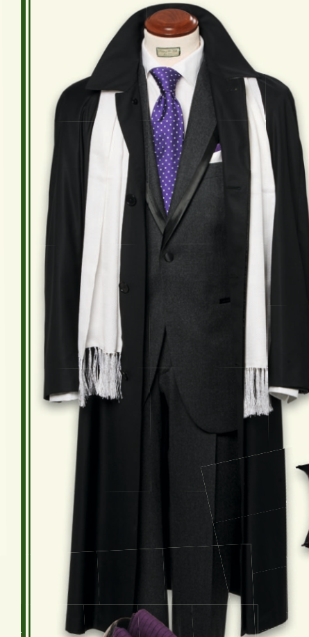
Paletot Scabal No.12 1699,- € Anzug Prüssing & Köll 998,- € Schirm mit Lurexdach 249,- € Seidenschal Handfranse 169,- €