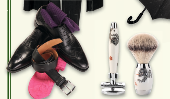
Mühle Rasurkultur: MEISSEN Edition Rasierpinsel mit Silberspitz Dachszupf 595,- € Rasierhobel 570,- € Weitere Modelle auf Anfrage.