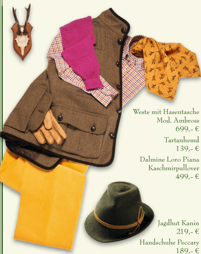
Weste mit Hasentasche Mod. Ambross 699,- € Tartanhemd 139,- € Dalmine Loro Piana Kaschmirpullover 499,- €